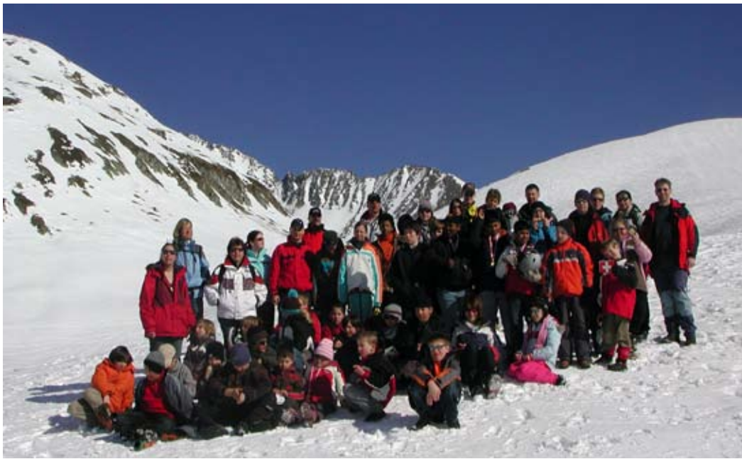
Das Ski- und Snowboardlager ist ein Angebot der "oink oink Productions" Jugendförderverein Oberes Kleinbasel